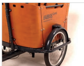
Anti-Rutsch-Ein- und Ausstieg