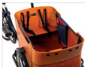
Elegante große Transportbox

* Das Babboe Curve Lastenfahrrad ist TÜV-geprüft (unabhängiges Prüfinstitut). Die angegebenen Gewichtsangaben beziehen sich auf Maximalwerte, die getestet wurden. Höhere Werte wurden nicht getestet.